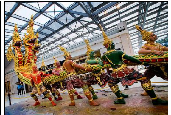
04:40 น. เดินทางถึงท่าอากาศยานสนามบินสุวรรณภูมิประเทศไทย โดยสวัสดิภาพพร้อมภาพความประทับใจ