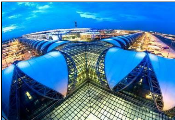
00:55 น. เห็นฟ้าสู่สนามบินสุวรรณภูมิ (ประเทศไทย) โดยสายการบินเจแปนแอร์ไลน์ เที่ยวบินที่ JL 727

16 เม.ย.68 สนามบินนานาชาติคันไซ – ประเทศไทย – สนามบินสุวรรณภูมิ (กรุงเทพฯ)