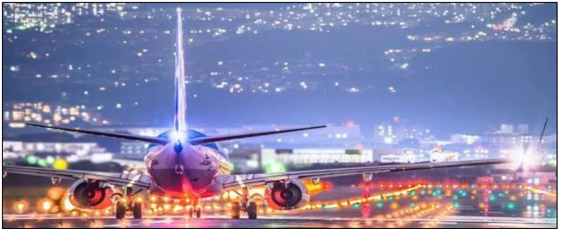
19:30 น. นำท่านเดินทางสู่สนามบินนานาชาติคันไซ (ใช้ระยะเวลาในการเดินทางประมาณ 15 นาที)

16 เม.ย.68 สนามบินนานาชาติคันไซ – ประเทศไทย – สนามบินสุวรรณภูมิ (กรุงเทพฯ)