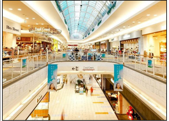
ค่า อีตระอาหารค่าตามอัยาศัย (ไม่รวมในรายการ)